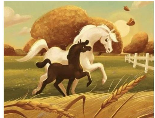
(Ilustratorka: Nana Homovec)